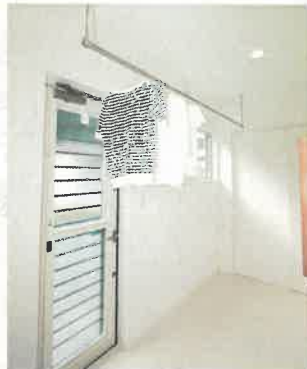
物干しスペース。脱衣カゴから洗う→室内干し→アイロンかけ→収納までの最短動線がポイント。