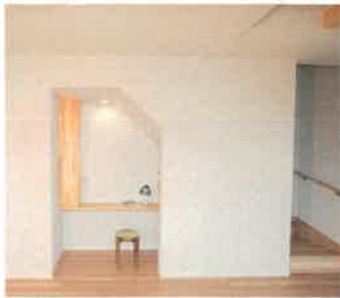
階段下のデッドスペースにカウンター・棚を設置。お子様の勉強や奥様の趣味のために。