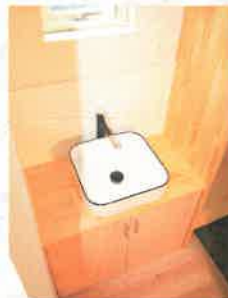
ファミリー用玄関の先には手洗器。帰ったらまず、手洗い・うがいを習慣に。