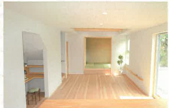
約20帖の広々としたLDK。一部を折上天井とし、より開放感のある空間になりました。また、キッチン・浴室・洗面室・洗濯機等の水廻りを集約したことで家事の負担を減らせます。