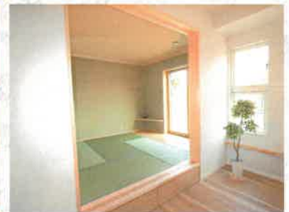
リビングから続く小上りの和室。LDKにいるご家族と目線の高さが近くなります。段差部分を利用して引出し収納も作りました。