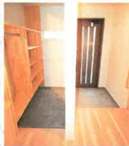
急な来客時にうれしい、ファミリー玄関。お客様用玄関はいつもスッキリ。