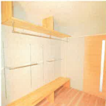
家族のクローゼット「カソクロ」2階の自分の部屋に行かなくても1階で荷物を置いて着替え完了。自然と片付くみんなのクローゼット。